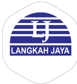
CV Langkah Jaya