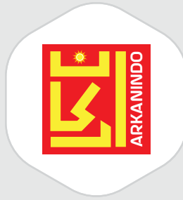
PT Arkanindo Buana Perkasa