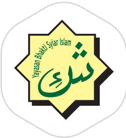
Yayasan Bhakti Syiar Islam