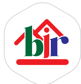
Aqiqah Center & Hewan Qurban