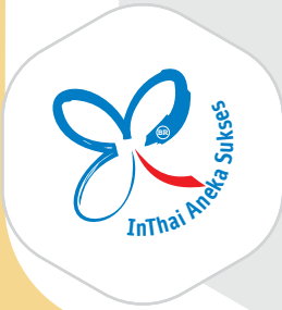
PT Inthai Aneka Sukses