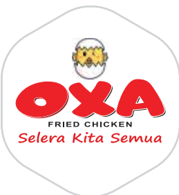
Oxa Fried Chicken